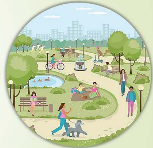
Parcs et jardins