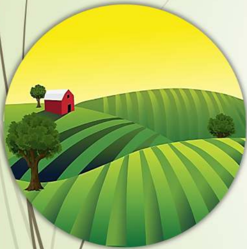
Forêts et prairies